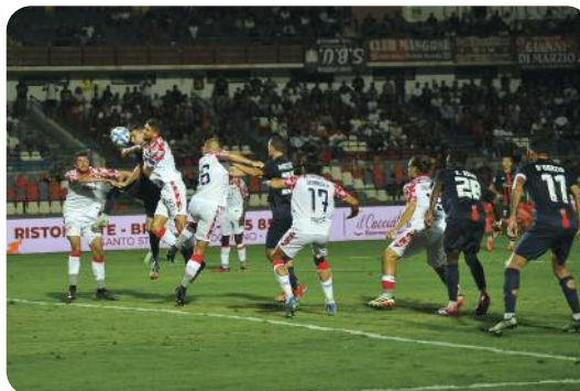
Fumagalli spizzica il pallone...