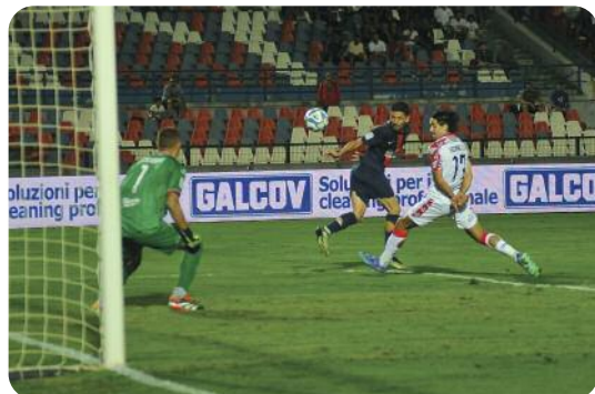
D'Orazio, di testa, ma il pallone è di poco fuori