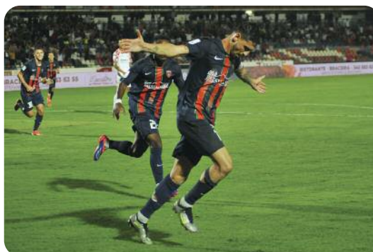
L'esultanza del Capitano