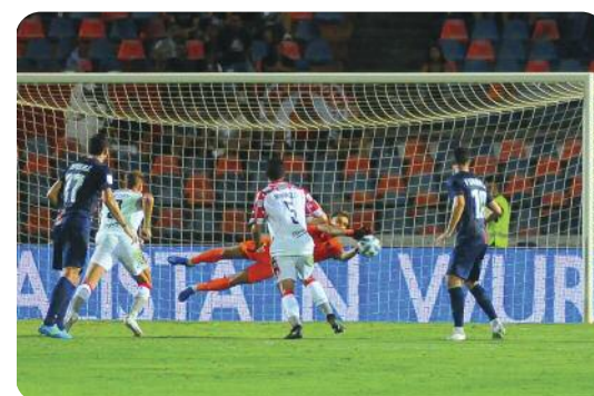
Il tiro di Collocolo è respinto in angolo da Micai