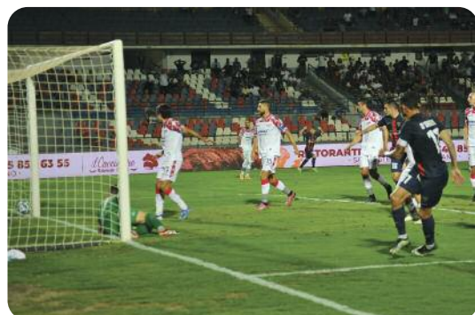
Il suo diagonale si infila a fil di palo