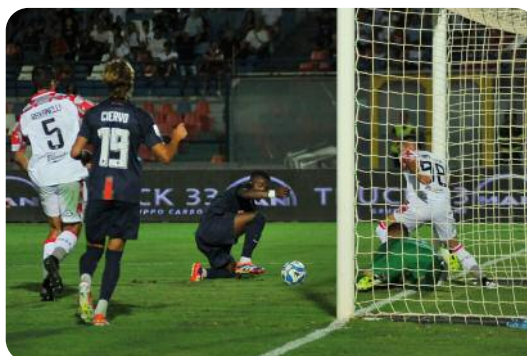
Kouan si vede respingere due volte i suoi tiri