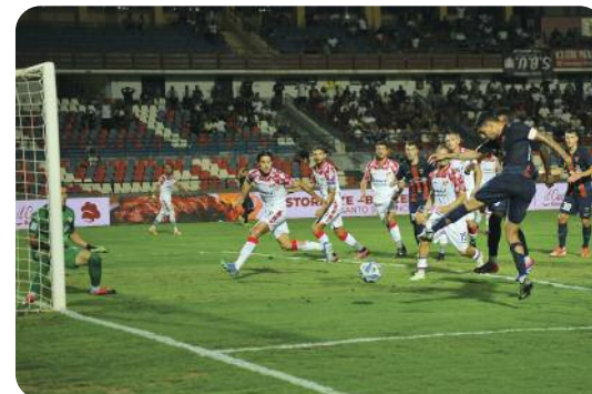
...che arriva dalle parti di D'Orazio